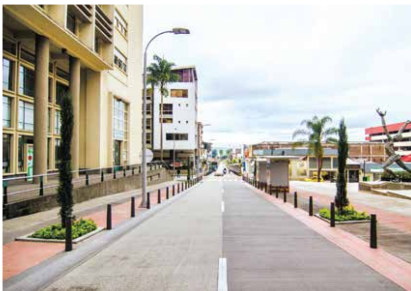
↑ Paisaje construido a través de franjas. DAVID SALAZAR

Se partió de la abstracción de las franjas que se observan en el paisaje cafetero de la región, para así implementar un sistema organizativo de franjas programáticas, que solucionaron los anteriores problemas que afectaban el gran valor histórico y cultural de la principal calle en la capital del Risaralda.