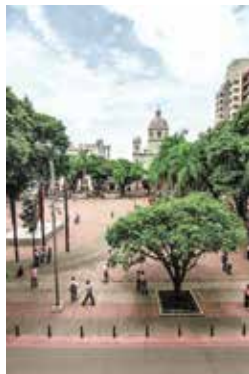
↑ Uniformidad en el paisaje. DAVID SALAZAR